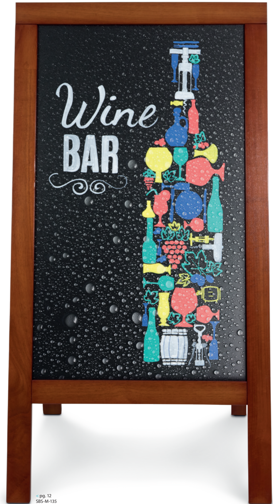
< pg. 12 SBS-M-135